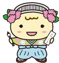
都島区社会福祉協議会 マスコットキャラクター 「みやこりん」